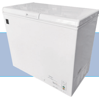
冷蔵・冷凍ストッカー

サイズ/W964×D577 H891 ㉜ 電気使用量/108W 収納容量/203ℓ 重さ/50kg