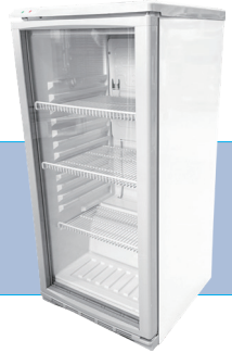
冷蔵ショーケース

サイズ/W475×D517 H1018 ㉜ 電気使用量/155W 収納容量/100ℓ 重さ/39kg