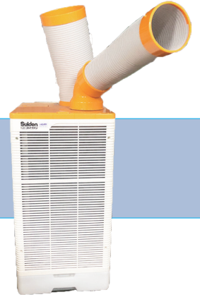
スポットクーラー